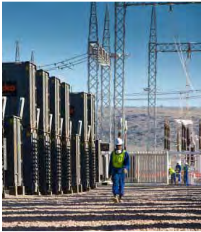
L'hydroélectricité occupe une place essentielle dans la capacité globale de production d'électricité du Congo. Une part qui devrait augmenter compte tenu des projets en cours.

20 MW. Inaugurée le 29 mai 2017, elle fournit l'électricité à la ville de Ouesso, mais va également desservir les autres localités du département ainsi que les sociétés de l'industrie forestière qui constituent le socle de l'économie départementale.