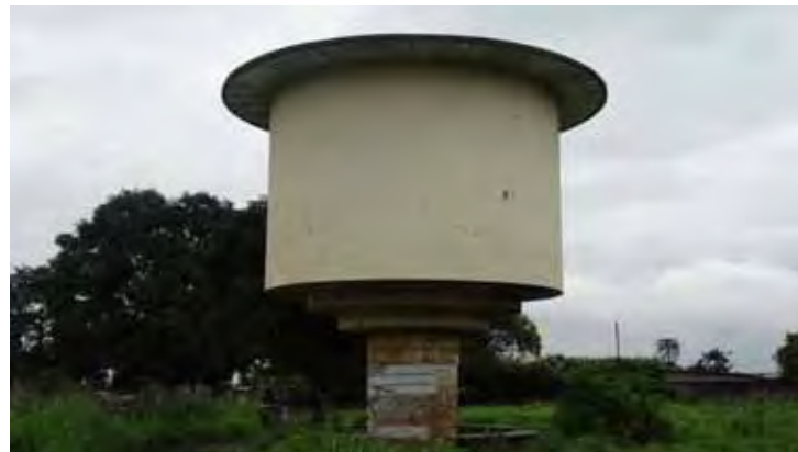
L'un des châteaux d'eau du premier réseau de distribution d'eau à Brazzaville, situé au camp 15 août.