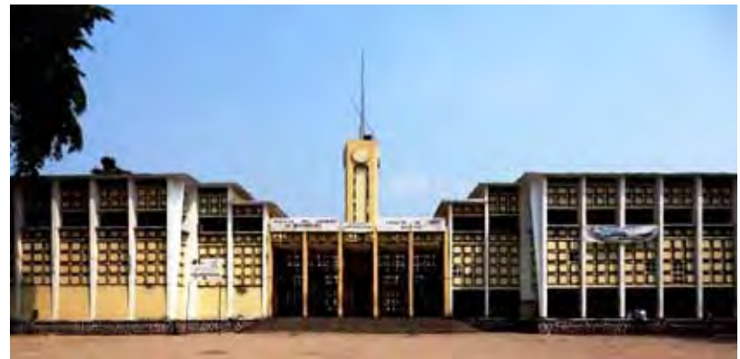
Façade principale du bâtiment de la première Assemblée nationale en 1959.

la gare du premier chemin de fer Congo à partir de 1905 et le premier aéroport de Brazzaville dès 1930, bien avant Maya-Maya en 1950. Cela a donné à ce quartier indigène un certain rayonnement sur le plan officiel et économique. Toutefois, il y a eu quelques exceptions de rues portant des