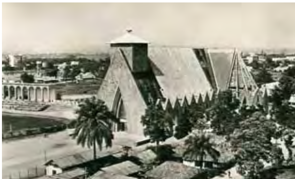
3. Chapelle de la mission catholique construite en 1887 dans l'enceinte de la Cathédrale.