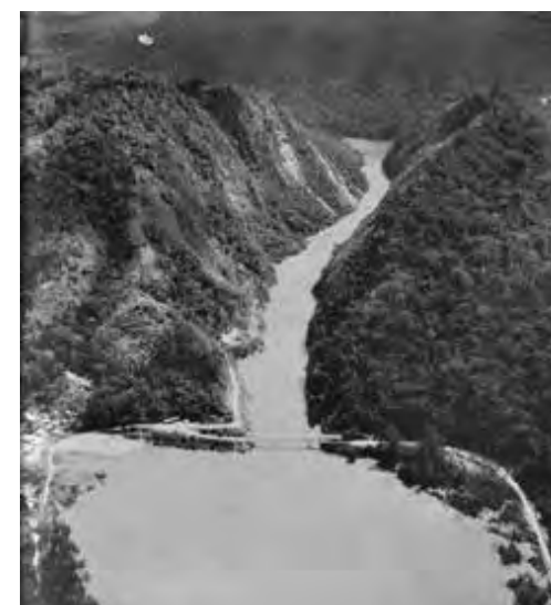
Amorcée avec la pose d'une première pierre en 1961, la réalisation du barrage de Sounda sur le fleuve Kouilou permettrait d'apporter une réponse au déficit énergétique qui pénalise le Congo.