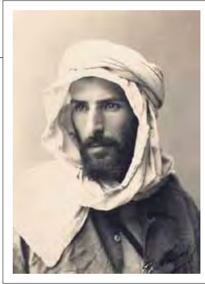
Pierre Savorgnan de Brazza, fondateur de Brazzaville.

Ouenzé, qui signifie « petit marché du soir », s'était également développé dans le cosmopolitisme des populations de toutes les tribus du Congo, avec notamment des poches de concentration tribale certainement favorisées par le phénomène sociologique du repli identitaire. Érigé en commune seulement en 1959, Ouenzé est un quartier plus ancien et très marécageux à l'origine. Les travaux de drainage entrepris avant l'indépendance, avec l'aménagement de différents bras de la rivière Madoukou, avaient permis d'assainir largement Ouenzé, Moundali et Poto-Poto. Talangaï a été créé entre 1964 et 1965 avec la première implantation de la population des maraîchers, principalement de la tribu Kongo, rapatriée de Léopoldville suite au conflit politique né entre le Congo et la RDC, d'où l'existence d'une église Kimbanguiste Kongo à Talangaï. Ce quartier s'est ensuite développé dans le cosmopolitisme, limité exclusivement aux populations congolaises qui ont hébergé